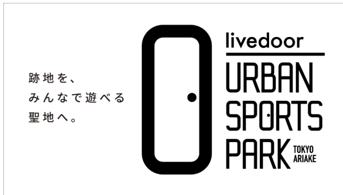
livedoor URBAN SPORTS PARK 施設ロゴ

ビレッジ社は「Tokyo Sports Wellness Village “ARIAKE”」をビジョンとし、アークスポーツをきっかけとした、誰もが輝き、健康的で幸せを感じるライフスタイルを実現できるまちづくりを目指しています。ミンカブは、本ビジョンに深く共感し、アークスポーツを通じた地域のにぎわい創出やまちづくりに貢献したいという思いから、ネーミングライツパートナーとなることを決定しました。