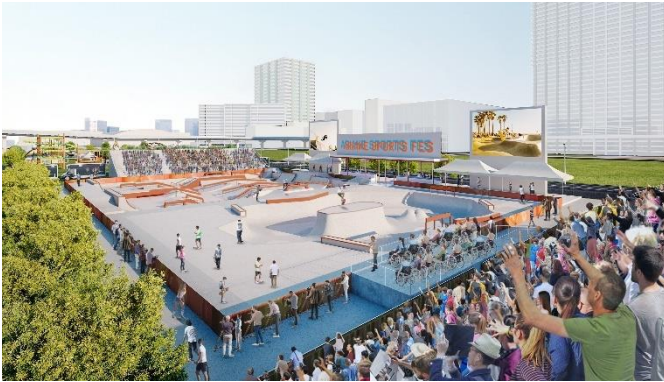
スケートボードパーク 活用イメージ

敷地面積約 3.1ha の規模を誇り、スケートボードパークや屋内ボルダリング棟、3x3 バスケットボールコートといったアーバンスポーツ施設に加え、屋外アスレチックやランニングスタジアムなどの運動施設、カフェやレストランなどの飲食施設を整備した複合型施設です。